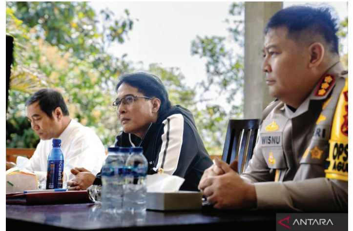
Bupati Badung I Nyoman Giri Prasta (tengah) saat memimpin Rakor terkait penyelenggaraan dan pengamanan Pilkada Kabupaten Badung tahun 2024, di ruang pertemuan Rumah Jabatan Bupati, Puspem Badung, Rabu (18/9).

Khusus untuk tahapan pengundian nomor urut pasangan calon, pihaknya juga meminta atensi dari pihak keamanan karena kegiatan itu akan melibat-