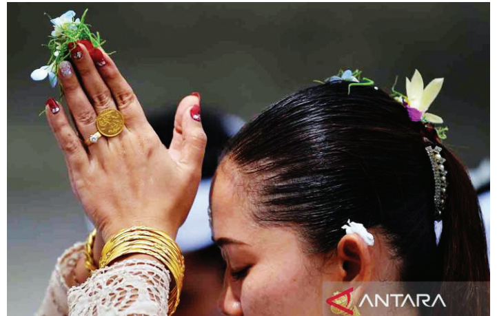
Umat Hindu melakukan persembahyangan Hari Raya Kuningan di Pura Sakenan, Denpasar, Bali, Sabtu (9/3/2024). Hari Raya Kuningan tersebut dirayakan umat Hindu sebagai rangkaian dari Hari Raya Galungan atau perayaan kemenangan kebenaran (Dharma) atas kejahatan (Adharma).

kenaikan harga di pasar sudah terjadi meskipun lonjakannya tak tinggi, diketahui berdasarkan portal Sigapura Pemprov Bali pada Kamis (12/9) lalu harga daging babi di Denpasar Rp85.000 per kilogram sementara hari ini menjadi Rp89.000.