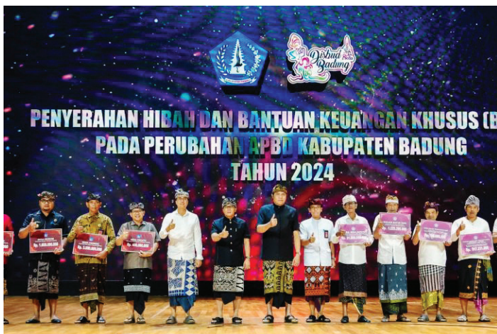
Bupati Badung Nyoman Giri Prasta menyerahkan bantuan dana hibah dan BKK kepada perwakilan Lembaga dan Pemerintahan Desa di Kabupaten Badung, di Balai Budaya, Giri Nata Mandala, Puspem Badung, Kamis (19/9/2024).

PEMERINTAH Kabupaten Badung, Bali menyerahkan bantuan dana hibah dan Bantuan Keuangan Khusus (BKK) senilai Rp 517 miliar kepada perwakilan lembaga dan pemerintahan desa di Badung.