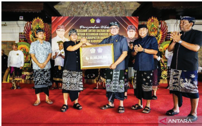
Bupati Badung I Nyoman Giri Prasta saat menyerahkan bantuan hibah dan BKK di Gianyar.

PEMERINTAH Kabupaten Badung, Bali menyerahkan bantuan hibah dan Bantuan Keuangan Khusus (BKK) pada program Badung Angelus Buana untuk masyarakat dan pemerintah di Kabupaten Gianyar.