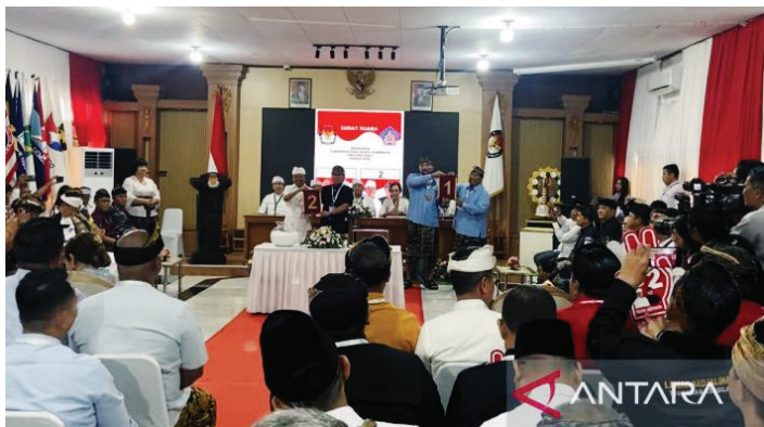
Dua pasangan calon peserta Pilkada Bali saat pengundian nomor urut di Denpasar, Senin (23/9/2024).

KOMISI Pemilihan Umum (KPU) Bali menetapkan nomor urut pasangan calon peserta Pilkada Bali 2024 setelah melalui pengundian.