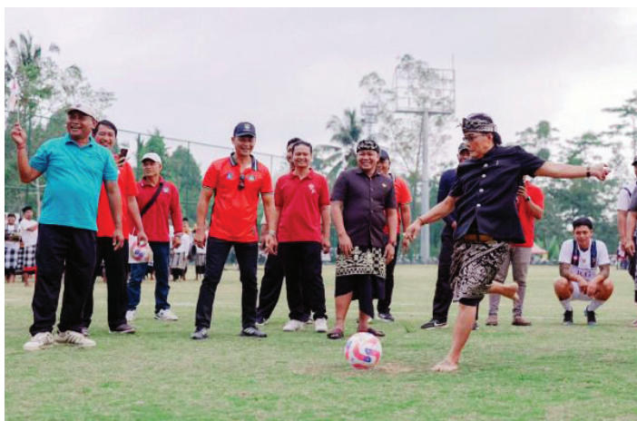
Bupati Nyoman Giri Prasta saat menghadiri membuka Turnamen Bupati Badung Cup (BBC) 2024 di Badung, Minggu (22/9/2024).

SEBANYAK 35 klub sepak bola mengikuti turnamen Bupati Badung Cup (BBC) 2024 di Kabupaten Badung, Bali yang diselenggarakan untuk menggali bibit-bibit pesepak bola usia muda di wilayah itu.