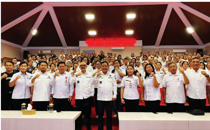
Suasana sosialisasi dan penjelasan capaian pembangunan di kabupaten Bangli.

BUPATI Bangli Sang Nyoman Sedana Arta melakukan sosialisasi dan menjelaskan capaian pembangunan di Kabupaten Bangli, Provinsi Bali, Kamis.