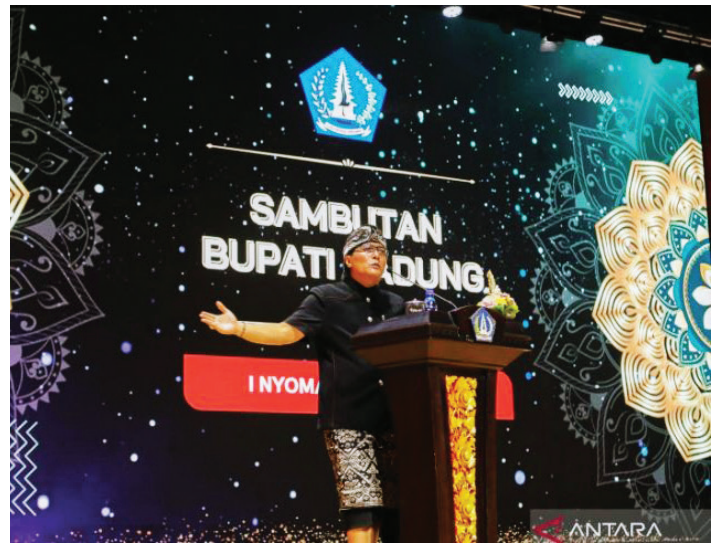
Bupati Badung I Nyoman Giri Prasta menyampaikan arahan saat Rakor dengan jajaran Pemerintah Desa se-Kabupaten Badung di Gedung Balai Budaya Giri Nata Mandala, Puspem Badung, Senin (23/9).

Dalam kegiatan yang diikuti 1.630 peserta yaitu kepala desa, BPD, perangkat desa dan unsur staf desa itu Bupati Giri Prasta juga memberikan perhatian