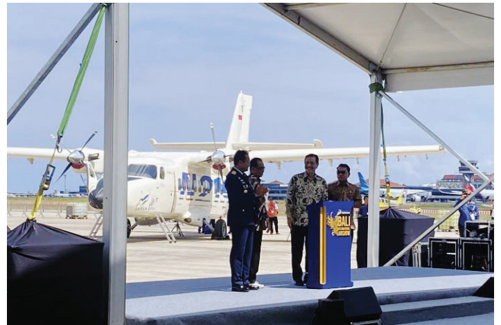
Menteri Koordinator Bidang Kemaritiman dan Investasi (Menkomarves) Luhut Binsar Pandjaitan saat membuka Bali International Airshow 2024 di Badung, Bali, Rabu (18/9/2024)

Sebagai negara kepulauan Indonesia telah melakukan