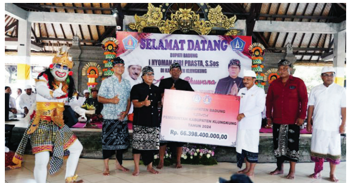
Bupati Badung Nyoman Giri Prasta menyerahkan dan hibah dan BKK untuk Kabupaten Klungkung, Bali, Minggu, (21/9/2024).

"Karena kami punya tiga prinsip, secara aspek filosofi sebenarnya hal ini sudah diinginkan sekali oleh para leluhur kami. Secara aspek sosiologis kami ini adalah bersaudara apalagi umat sedharma dan se-