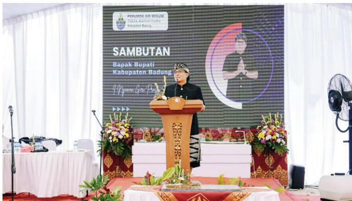
Bupati Badung I Nyoman Giri Prasta melakukan peletakan Batu Pertama Pembangunan Kantor Perumda Air Minum Tirta Mangutama, di Kelurahan Kapal, Mengwi, Kamis (19/9/2024).

BUPATI Badung, Bali I Nyoman Giri Prasta meminta Perusahaan Daerah (Perumda) Air Minum Tirta Mangutama Badung untuk terus memberikan pelayanan yang maksimal kepada masyarakat.