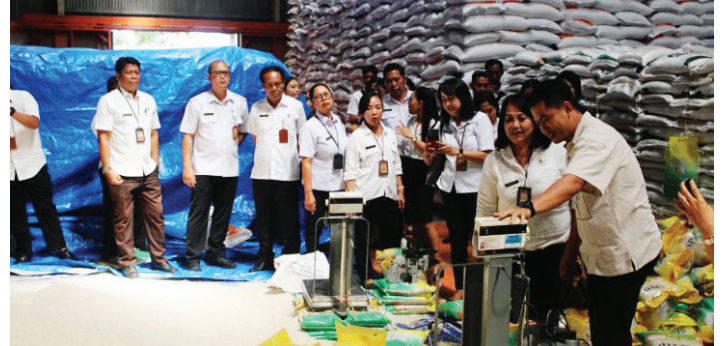
Tim Pengendalian Inflasi Daerah (TPID) Kota Denpasar kembali melaksanakan pemantauan Stok Beras di Gudang Bulog, Sempidi, Badung, Bali, Kamis (18/9/2024).

Dalam kesempatan ini, pihaknya pun menghimbau masyarakat untuk tidak melakukan pembelian