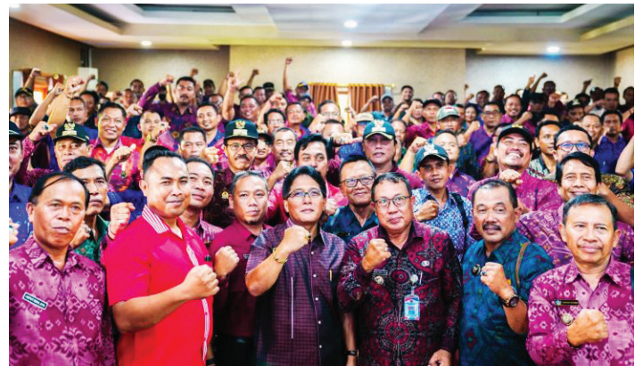
Bupati Badung Nyoman Giri Prasta melakukan audiensi 129 Perbekel se-Kabupaten Buleleng di Mangupura, Badung, Jumat (12/4).

"Upaya ini dilakukan dengan mengedepankan kesadaran kolektif tentang pentingnya kolaborasi dalam membangun Bali secara