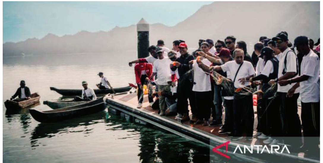
Bupati Bangli Sang Nyoman Sedana Arta memimpin gebyar penanganan ikan predator Red Devil di danau Batur.

Menurut para ahli lingkungan, lanjut dia, Danau Batur menghadapi dua masalah besar yaitu pertama sedimentasi atau pendangkalan dan kedua pencema-