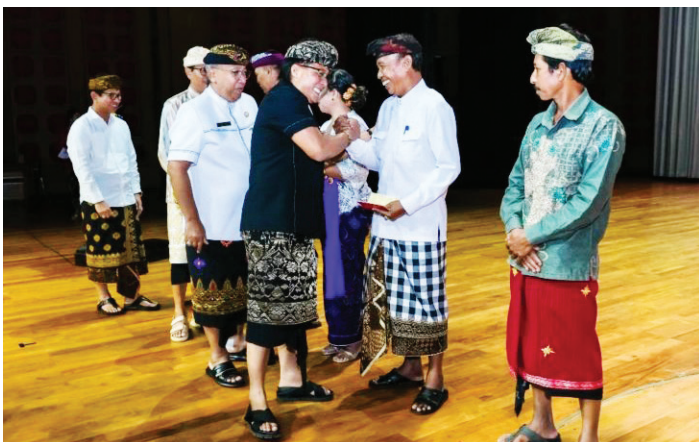
Bupati Badung I Nyoman Giri Prasta (tengah) saat penyerahan hibah dan BKK di Balai Budaya Giri Nata Mandala, Puspem Badung, Rabu (3/4/2024).

PEMERINTAH Kabupaten Badung, Bali menyerahkan dana hibah uang kepada masyarakat dan Bantuan Keuangan Khusus (BKK) kepada pemerintah desa pada APBD tahun anggaran 2024 senilai Rp979 miliar untuk mendukung pembangunan dan meningkatkan