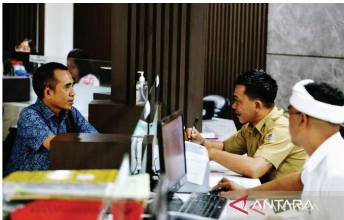
Petugas memberikan layanan publik kepada warga di Mal Pelayanan Publik Graha Sewaka Dharma Denpasar, Bali, Senin (8/4/2024).

PEMERINTAH Kota Denpasar, Bali, mencatat 496 warga di daerah itu memanfaatkan Mal Pelayanan Publik (MPP) Sewakadarma Kota Denpasar saat cuti bersama Idul Fitri 1445 Hijriah pada 8 dan 9 April 2024.