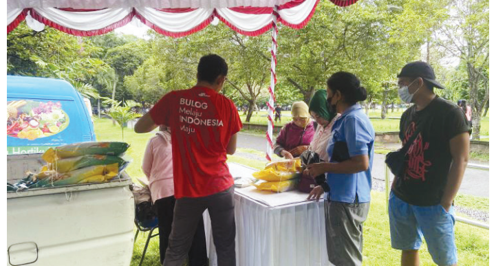
Gerakan pangan murah yang digelar Pemprov Bali di Denpasar, Senin (1/4/2024).

Upaya pemerintah lainnya adalah menggelar gerakan pangan