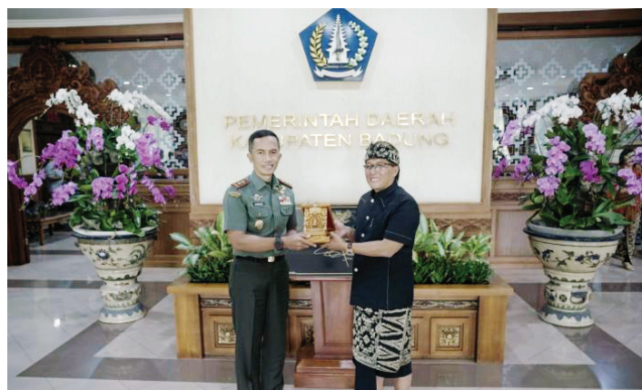
Bupati Giri Prasta (kanan) menerima kunjungan silaturahmi Pangdam IX/Udayana Mayor Jenderal TNI Bambang Trisnohadi (kiri) di Puspem Badung, Juma(28/3).

BUPATI Badung, Nyoman Giri Prasta, menegaskan peran strategis Tentara Nasional Indonesia (TNI) dalam menjaga keamanan wilayah, terutama dalam situasi luar biasa seperti pandemi Covid-19.