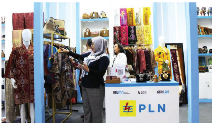
Pelanggan melihat produk Usaha Mikro, Kecil dan Menengah (UMKM) di Rumah BUMN Denpasar, Bali yang diprakarsai melalui program Hari Belanja Nasional (Harbelnas) PLN yang diselenggarakan sejak 1 Mei 2023.

PT PLN (Persero) mencatat jumlah transaksi penjualan Usaha Mikro, Kecil dan Menengah (UMKM) di Rumah BUMN Denpasar melalui program Hari Belanja Nasional (Harbelnas) PLN mencapai Rp27,7 juta.