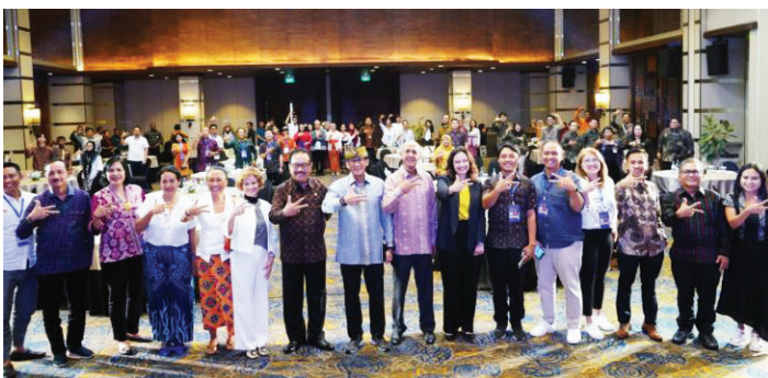
Wagub Bali Tjok Oka Artha Ardhana Sukawati dan Menparekraf Sandiaga Uno saat membuka peluncuran proyek branding pariwisata dan ekonomi kreatif, Denpasar, Rabu (17/5/2023).

WAKIL Gubernur Bali Tjok Oka Artha Ardhana Sukawati dalam peluncuran proyek branding pariwisata dan ekonomi kreatif menyampaikan harapannya agar kerja sama dengan World Intellectual Property Organization (WIPO) dapat meningkatkan nilai tambah produk dan jasa.