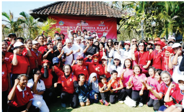
Wakil Gubernur Bali Tjok Oka Artha Ardhana Sukawati saat membuka Festival Olahraga Rekreasi Daerah di Denpasar, Sabtu (20/5/2023).

nyelenggaraan Forda, ke depan masyarakat semakin bersemangat dalam menekuni olahraga rekreasi, karena manfaatnya akan dirasakan setiap individu.