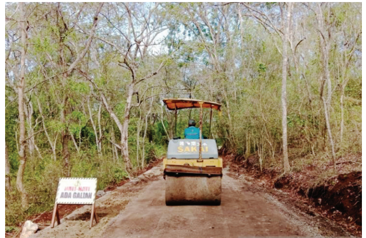
Proses pengaspalan jalan menggunakan campuran sampah plastik di Kawasan Pura Segara Rupek, Kecamatan Gerokgak, Kabupaten Buleleng.

Untuk bahan baku plastik, terang Adiptha sudah disiapkan plastik yang telah dicacah oleh penyedia di Rumah Plastik Petandakan.