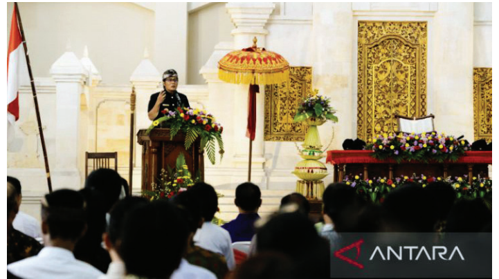
Bupati Badung I Nyoman Giri Prasta meresmikan Gereja GKPB Jemaat Philadelphia di Kelurahan Legian, Kecamatan Kuta, Badung, Bali, Senin (22/5/2023).

"Ini juga berkat kebijakan strategis Bupati Giri Prasta. Saya