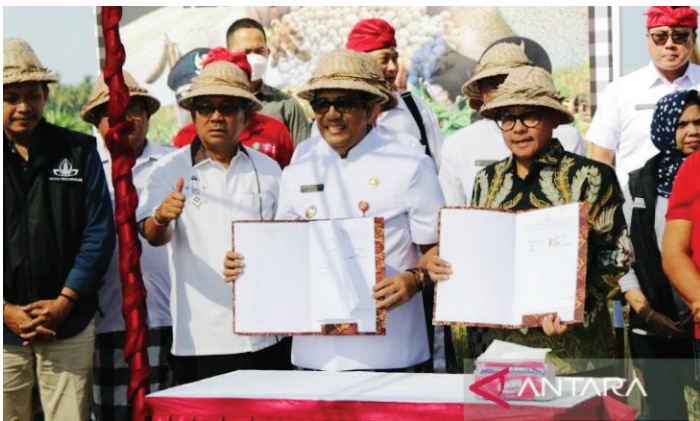
Pemkab Tabanan - Pemkot Malang Kerja Sama Tingkatkan Ketahanan Pangan.

PEMERINTAH Kabupaten Tabanan, Bali menjalin kerja sama dengan pemerintah Kota Malang, Jawa Timur sebagai upaya untuk meningkatkan ketahanan pangan khususnya kedelai serta mengurangi ketergantungan terhadap kedelai impor.