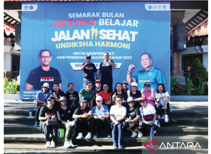
Jajaran pimpinan Undiksha Singaraja, Bali foto bersama dalam rangkaian jalan sehat Merdeka Belajar.

Pelaksanaan Program MBKM dinilai telah memberikan kontribusi dalam peningkatan kompetensi mahasiswa dan memperkuat keberterimaan lulusan Undiksha di masyarakat.