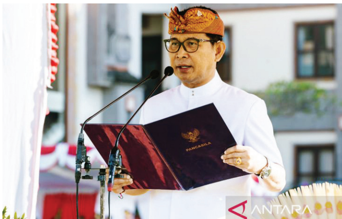
Sekda Badung I Wayan Adi Arnawa menjadi inspektur upacara peringatan Hari Kebangkitan Nasional 2023.

PEMERINTAH Kabupaten Badung, Bali meminta seluruh masyarakat di wilayah itu terus mempertahankan semangat kebangkitan nasional dengan merapatkan barisan perjuangan dan menunjukkan kerja keras, cerdas, dan bersama.