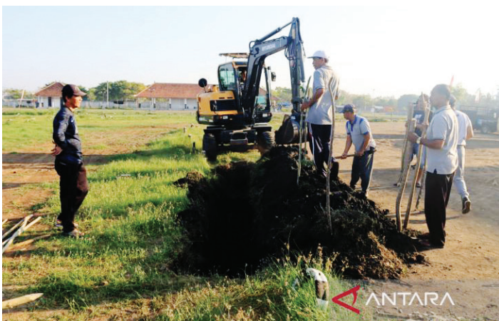
Penyempurnaan lintasan makepung di Sirkuit All in One Desa Pengambangan, Jembrana Kamis (25/5).

JALAN tol Bali yang membentang dari Gilimanuk hingga Mengwi, akan menarik wisatawan untuk menonton budaya pacuan kerbau Makepung di Kabupaten Jembrana.