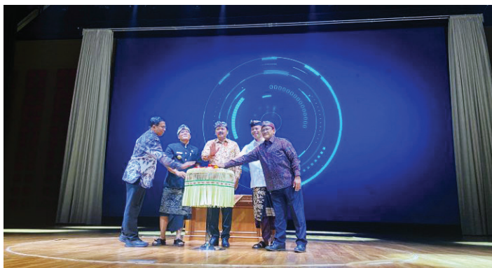
Menteri ATR/BPN Hadi Tjahjanto saat mendeklarasikan Badung sebagai kabupaten lengkap, Badung, Bali, Kamis (25/5/2023).

MENTERI Agraria dan Tata Ruang/Kepala Badan Pertanahan Nasional (ATR/BPN) Hadi Tjahjanto mendeklarasikan Kabupaten Badung, Bali, sebagai Kabupaten Lengkap pertama di Indonesia.