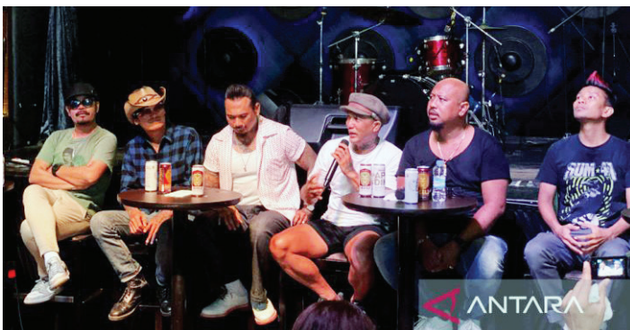
Musisi lokal yang akan tampil di Singaraja Fest 2023.

Dia mengharapkan keberlanjutan program ini bisa terjamin dan digaransi oleh masing-masing fakultas. Program ini sebagai akselerasi pencapaian pendidikan yang bermutu. (ant)