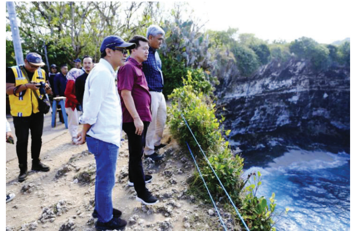
Bupati Klungkung I Nyoman Suwirta (baju merah) dan Perwakilan Kementerian PPN/Bappenas meninjau sejumlah infrastruktur pendukung dalam upaya menjadikan Nusa Penida menjadi Kawasan Strategis Pariwisata Nasional (KSPN) di Nusa Penida, Kabupaten Klungkung, Bali.

Bupati memaparkan sejumlah fasilitas yang perlu perbaikan dan sentuhan pemerintah pusat