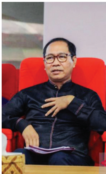
Wabup Badung I Ketut Suiasa saat mengikuti acara Verifikasi Lapangan Secara Hybrid Evaluasi KLA Kabupaten Badung Tahun 2023.

Wabup Ketut Suiasa mengatakan, generasi muda merupakan penerus cita-cita perjuangan bangsa yang memiliki peran strategis