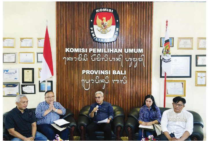
Tim seleksi calon anggota KPU Bali saat konferensi pers di Denpasar.

membocorkan mengenai siapa saja pendaftar dalam sepekan terakhir, namun ia memastikan bahwa seluruh pendaftar berasal dari beragam profesi, yang nantinya akan disesuaikan dengan ketentuan pendaftaran.