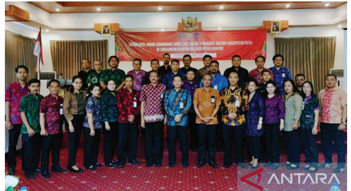
Sosialisasi jaring komunikasi sandi untuk mencegah kebocoran data di Gianyar, Bali, Jumat (26/5/2023).