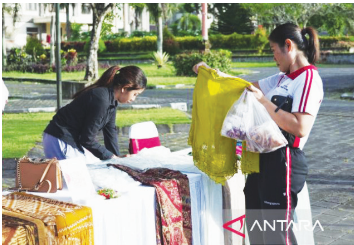
Pelaksanaan kegiatan Jumat Ceria bersama UMKM Kabupaten Badung.

DINAS Perhubungan Kabupaten Badung di Provinsi Bali mengerahkan 165 petugas lapangan untuk membantu mengatur lalu lintas kendaraan pada masa mudik Lebaran 2023.