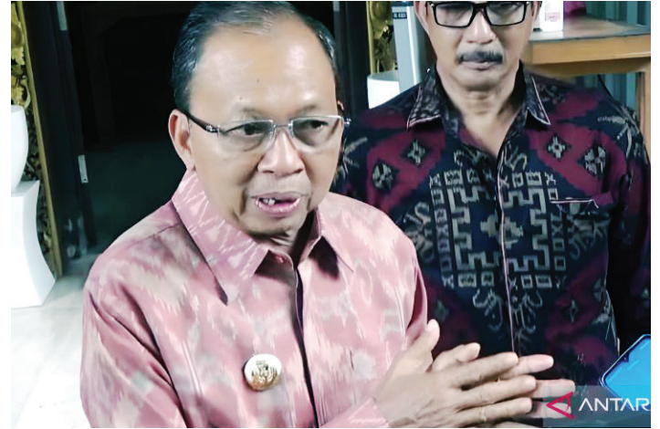
Gubernur Bali Wayan Koster menyampaikan harapan agar proyek Terminal LNG Sidakarya dapat berlanjut di Denpasar, Bali, Jumat (14/4/2023).

Adapun surat penjelasan yang disampaikan Koster kepada Menko Marves adalah hasil kajian aspek keamanan, keselamatan operasi, dan pelayaran dalam pembangunan Terminal LNG yang membuktikan bahwa tidak ada isu lingkungan yang