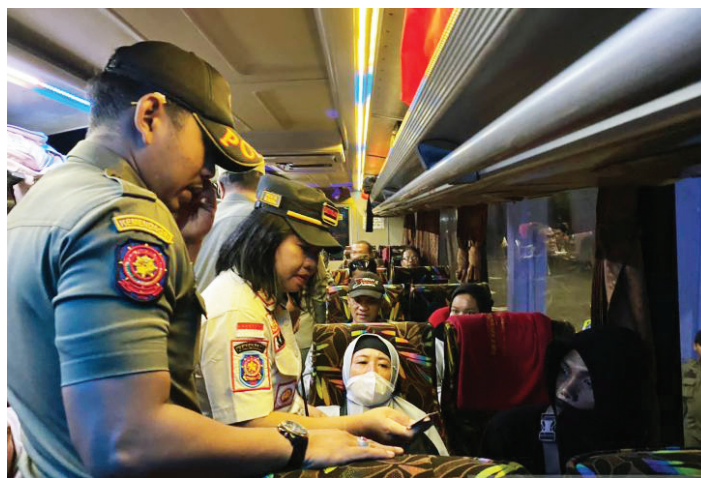
Sidak penduduk pendatang (Duktang) di Terminal Tipe A Mengwi, Badung.

“Terkait proses pemulangan warga yang tidak memiliki identitas ini dikoordinasikan dengan Dinas Sosial Badung yang juga berkoordinasi dengan Dinas