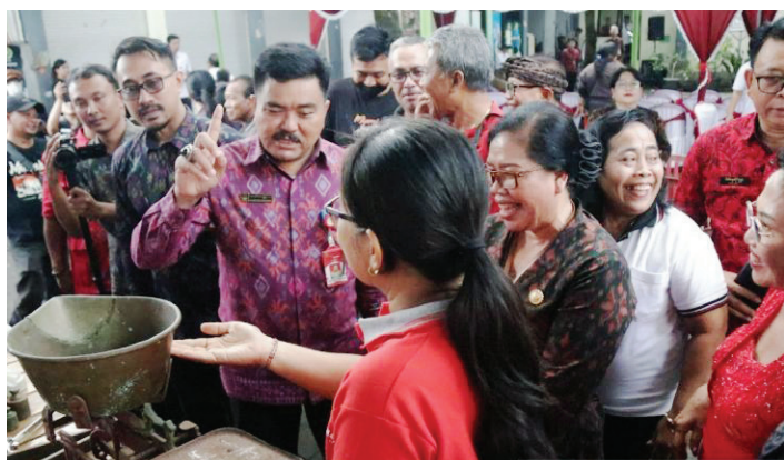
Pasar murah di Tabanan.

DINAS Perindustrian dan Perdagangan Inovasi Pasar, Kabupaten Tabanan, Bali, menyelenggarakan pasar murah di Pasar Kediri Tabanan untuk mencegah kerawanan pangan.