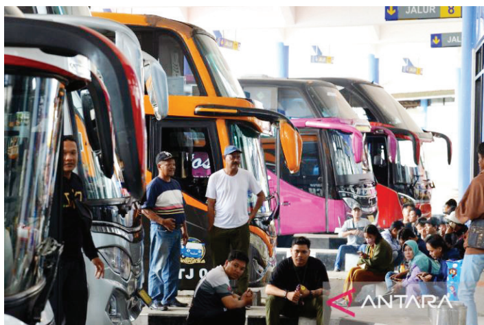
Suasana Terminal Mengwi Badung.

DINAS Perhubungan Kabupaten Badung di Provinsi Bali mengerahkan 165 petugas lapangan untuk membantu mengatur lalu lintas kendaraan pada masa mudik Lebaran 2023.