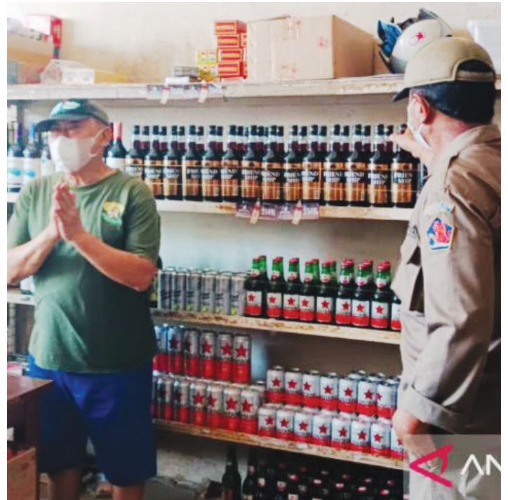
Anggota Satpol PP Buleleng saat melakukan pemantauan miras tak berizin pada sejumlah toko di wilayah tersebut.