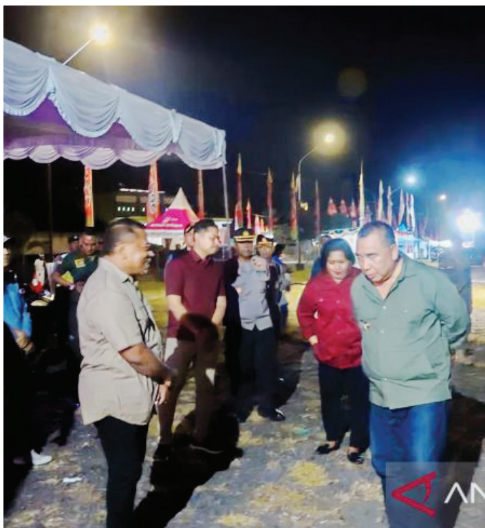
Target PAD Jembrana dari retribusi penimbangan ikan berpotensi tidak tercapai akibat paceklik penangkapan ikan di laut, Kamis (13/4).

BADAN Pengelolaan Keuangan Dan Aset Daerah (BPKAD) Jembrana menyebutkan Target Pendapatan Asli Daerah (PAD) Kabupaten Jembrana, Bali dari retribusi penimbangan ikan tidak tercapai karena paceklik panjang penangkapan ikan di laut.