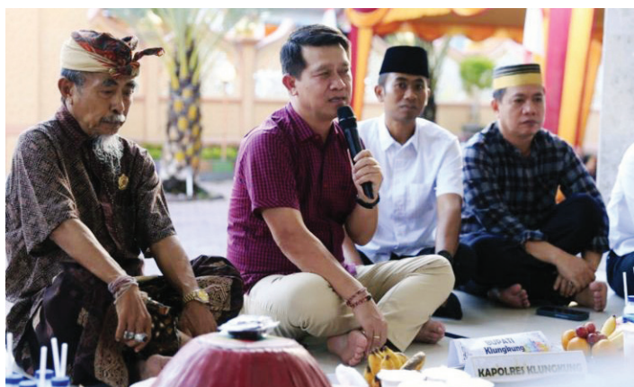
Bupati Klungkung I Nyoman Suwirta memberikan sambutan saat menghadiri kegiatan buka puasa bersama di Kampung Gelgel, Kabupaten Klungkung, Bali.

BUPATI Klungkung I Nyoman Suwirta mengajak warga tetap menjaga toleransi beragama yang telah dihidupkan di Kampung Gelgel yang merupakan kampung Muslim tertua di Bali.