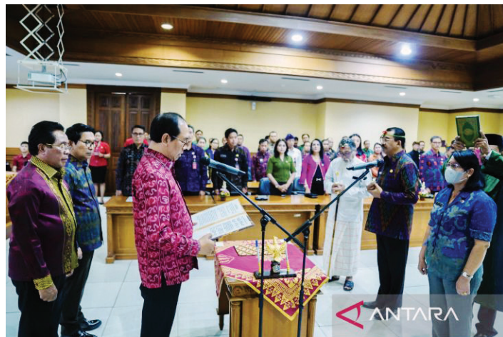
Wabup Badung I Ketut Suiasa saat memimpin acara selantikan dan pengambilan sumpah jabatan Pejabat untuk menduduki Jabatan Eselon II, Eselon III dan Eselon IV, Selasa (18/4) di Puspem Badung.

Ia menambahkan pelaksanaan mutasi yang dilakukan di Badung harus dimaknai sebagai usaha untuk melakukan pembenahan dan pementapan organisasi.