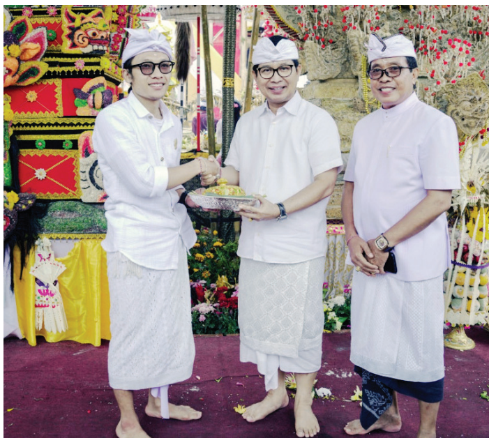
Umat Hindu menjalani upacara Melasti jelang Hari Raya Nyepi di Kabupaten Badung.

SERANGKAIAN Karya Ngusaba Kedasa di Pura Ulun Danu Batur, Kintamani Badung, Sekda Badung I Wayan Adi Arnawa