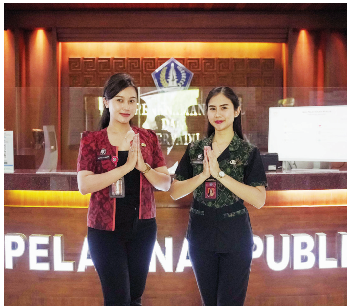
Mall Pelayanan Publik Kabupaten Badung.

Para pegawai tetap melakukan pelayanan, salah satu-