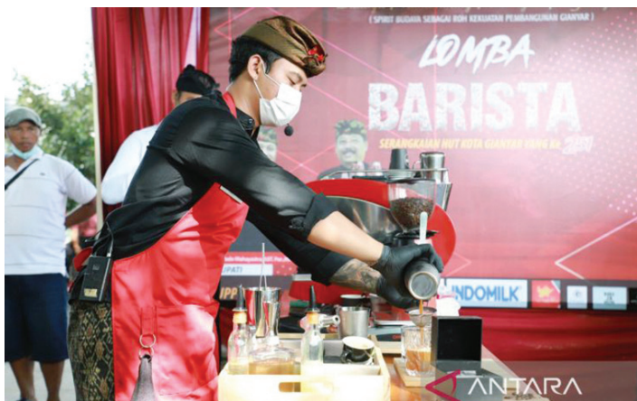
Salah seorang peserta lomba barista sedang membuat kopi

PEMERINTAHAN Kabupaten Gianyar, Provinsi Bali, dalam rangka memperingati HUT ke-251 menggelar lomba untuk barista guna mendorong generasi muda berbisnis minuman kopi yang kini sedang marak.