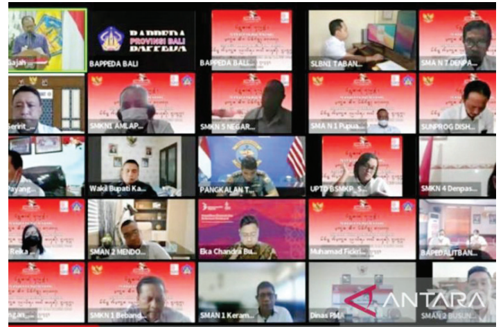
Gubernur Bali Wayan Koster beserta para peserta Musrenbang yang mengikuti kegiatan secara virtual di Denpasar, Rabu (6/4/2022).

Dalam sambutannya, Koster menyatakan sangat mengapresiasi karena telah memasuki tahun