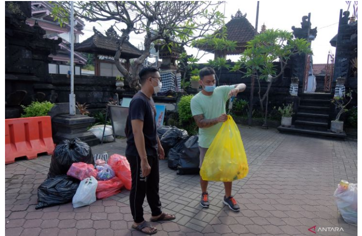
Petugas menimbang sampah milik seorang warga di Bank Sampah Dharma Laksana, Banjar Kaja, Kelurahan Panjer, Denpasar, Bali, Minggu (3/4/2022).

Kastorius mengatakan pengelolaan sampah di Kawasan Sarbagita memerlukan inovasi dan percepatan, sebagai