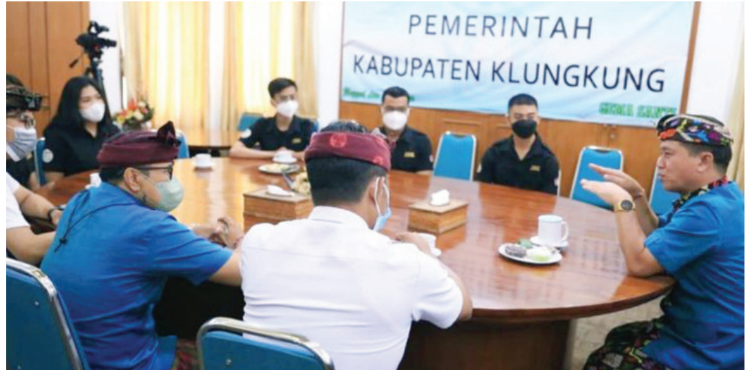
Bupati Klungkung, I Nyoman Suwirta, menerima Panitia Jegeg Bagus Klungkung di Ruang Rapat Kantor Bupati Klungkung (31/3/2022).

"Ada tiga aspek utama yang harus dimiliki sebagai seorang jegeg bagus, yakni