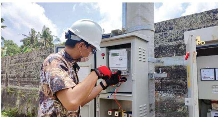
Penjualan listrik PLN meningkat di kuartal pertama 2022

PT PLN (Persero) UID Bali mencatat kenaikan penjualan listrik sebesar 802,01 Giga Watt hour (GWh) pada kuartal pertama 2022, atau naik 5,78 persen dibandingkan penjualan listrik pada periode yang sama tahun 2021 (YoY). Kenaikan ini didukung oleh beberapa program PLN yang diusung untuk menggenjot penjualan listrik.