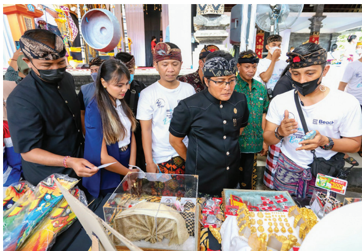
Bupati Nyoman Giri Prasta (dua kanan) menghadiri acara Kick Off Program Banjar Creative Space di Balai Banjar Ubung Jimbaran Kuta Selatan, Minggu (10/4).

BUPATI Giri Prasta membuka acara Kick Off Program Banjar Creative Space yang telah dicanangkan Pemerintah Kabupaten Badung sejak Bupati Nyoman Giri Prasta dan Wakil Bupati Ketut Suiasa membuat kebijakan membangun Balai Banjar yang dilengkapi WiFi gratis bagi