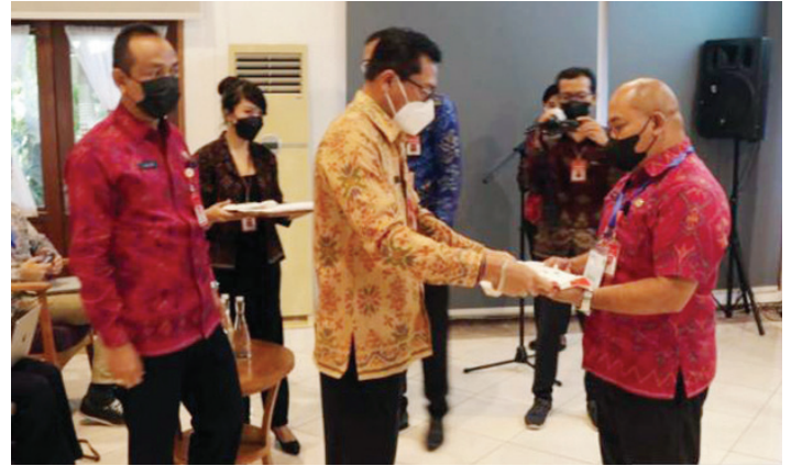
Pelatihan peningkatan kapasitas pemangku kepentingan pengelolaan sampah terintegrasi dan berkelanjutan di Kabupaten Tabanan, Bali.

Berbagai regulasi sudah dikeluarkan sejak 2013 hingga 2021, termasuk Pergub Nomor 47 Tahun 2019 tentang Sampah Berbasis Sumber yang terus-menerus disosialisasikan ke masyarakat, namun tentunya membutuhkan partisipasi yang tinggi dari seluruh masyarakat.