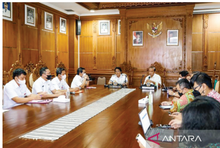
Bupati Badung I Nyoman Giri Prasta (tengah).

“Kami berharap proyek KPBU jalan lingkar selatan di Badung dapat segera terwujud sehingga