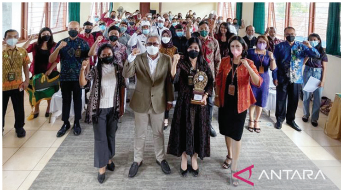
PN Bangli adakan sosialisasi E-Court (Electronic Court) kepada Advokat Anggota DPC Peradi Denpasar, kalangan perbankan dan perangkat desa

penyisihan terpilih 10 pasang finalis jegeg bagus. Tanggal 24 April 2022 akan dilaksanakan Fashion Show bertempat di Pendopo Puri Agung Klungkung dan Grand Final pada 28 April 2022, sekaligus memperingati hari Puputan Klungkung ke-114 dan HUR ke-30 Kota Semarapura," jelas A.A Gede Putra Wedana. (ant)