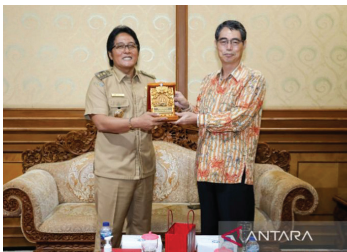
Bupati Badung I Nyoman Giri Prasta saat menerima kunjungan kerja Konjen Republik Korea Selatan Moon Young Ju, Senin (11/4).

BUPATI Badung I Nyoman Giri Prasta menerima kunjungan kerja Konsulat Jenderal Republik Korea Selatan di Bali Moon Young Ju, dalam rangka meningkatkan hubungan kerja sama di bidang kepariwisataan.