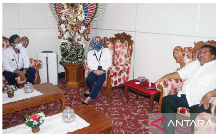
Bupati Buleleng, Bali Putu Agus Suradnyana saat menerima audiensi Ketua Pengadilan Negeri Singaraja Heriyanti, di Kantor Bupati Buleleng, Senin (4/3/2022).

BUPATI Buleleng, Bali Putu Agus Suradnyana mengapresiasi program-program dari Pengadilan Negeri (PN) Singaraja pada bidang pelayanan infrastruktur sarana dan prasarana, khususnya untuk penyandang disabilitas di wilayah tersebut.