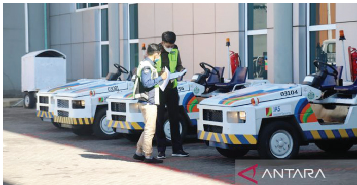
Pelaksanaan ramp check' Ground Service Equipment (GSE) di Bandara Bali.

PT Angkasa Pura I Bandara Internasional I Gusti Ngurah Rai Bali bersama Otoritas Bandara Wilayah IV melakukan 'ramp check' Ground Service Equipment (GSE) sebagai dukungan untuk penerbangan normal operation dan persiapan kegiatan KTT G20.