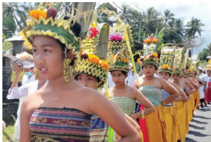
Penari Rejang Dewa di Desa Adat Nongan, Karangasem