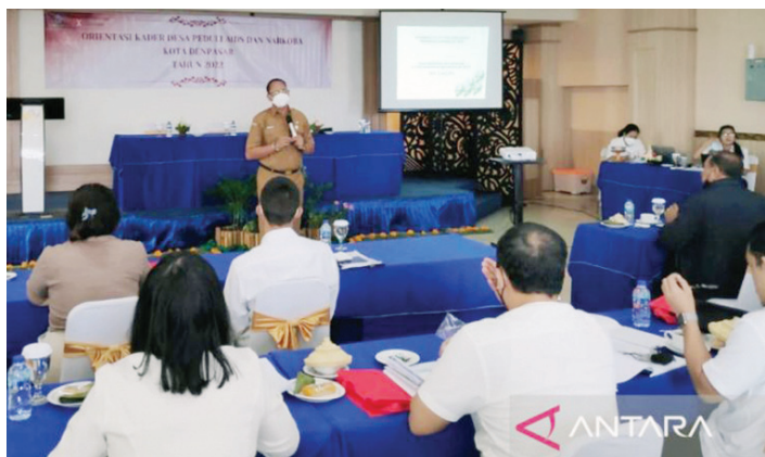
Diskes Denpasar selenggarakan orientasi Kader Desa Peduli AIDS dan Narkoba.

DINAS Kesehatan dan Komisi Penanggulangan AIDS (KPA) Kota Denpasar, Bali menyelenggarakan orientasi Kader Desa Peduli AIDS dan Narkoba (KDPAN) guna menekan laju epidemi HIV/AIDS di kota setempat.