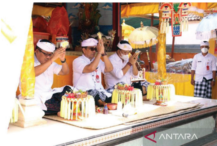
Bupati Tabanan, I Komang Gede Sanjaya, saat menghadiri Uleman Karya Ngenteg Linggih Wraspati Kalpa Ring Pura Ciwa lan Batur Kawitan Gusti Den Tembok di Desa Adat Bedha, Desa Sudimara, Kecamatan Tabanan, Kamis (7/4/2022).

BUPATI Tabanan, I Komang Gede Sanjaya, meminta masyarakat tetap menerapkan protokol kesehatan (prokes) dalam setiap berkegiatan, meskipun Pandemi COVID-19 di Tabanan sudah nampak