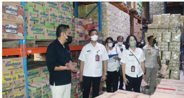
Satgas Pangan bersama Tim Pengendali Inflasi Daerah (TPID) yang dibentuk di Kabupaten Badung, Bali melakukan pemantauan ketersediaan dan harga berbagai bahan pokok.

SATGAS Pangan bersama Tim Pengendali Inflasi Daerah (TPID) yang dibentuk di Kabupaten Badung, Bali melakukan pemantauan ketersediaan dan harga berbagai bahan pokok di gudang distributor, pasar modern serta pasar tradisional