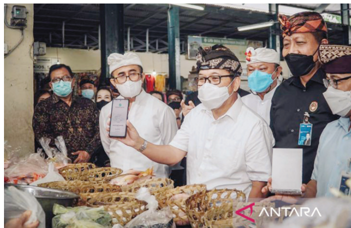
Kepala KPwBI Provinsi Bali Trisno Nugroho saat menunjukkan bertransaksi menggunakan QRIS di Pasar Nyanggelen pada Senin (4/4/2022).

Melalui program Semarak QRIS ini, bagi pembeli dan pedagang yang bertransaksi menggunakan QRIS di pasar tersebut, selama periode satu bulan (1-30 April 2022) akan memiliki kes-